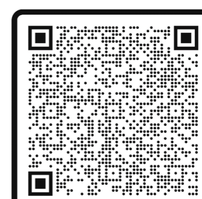
Doctorado en Philosophia