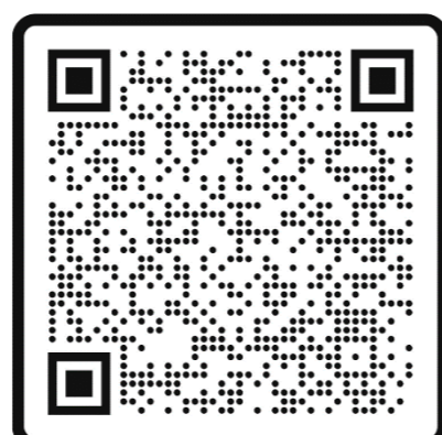
Maestría en Ecología y Medio Ambiente